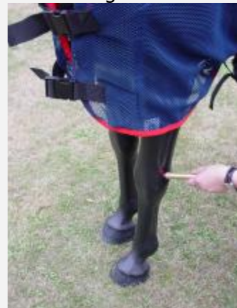
WLP Pointer rot 635 nm

Unser Wave-Light-Pulse System ermöglicht variable Anwendungen.