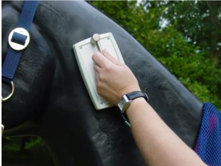
Kombinierte WLP-Dusche im Einsatz

Wave-Light-Pulse bedeutet, daß mit einem einzigen Produkt 3 Anwendungen kombiniert werden können. Licht einer bestimmten Wellenlänge (kein kohärentes Licht) mit einer gepulsten Frequenz wird in freier Kombination mit pulsierendem Magnetfeld generiert. Und das einfach und praktisch über die bereits eingesetzte Multifunktionsbox.