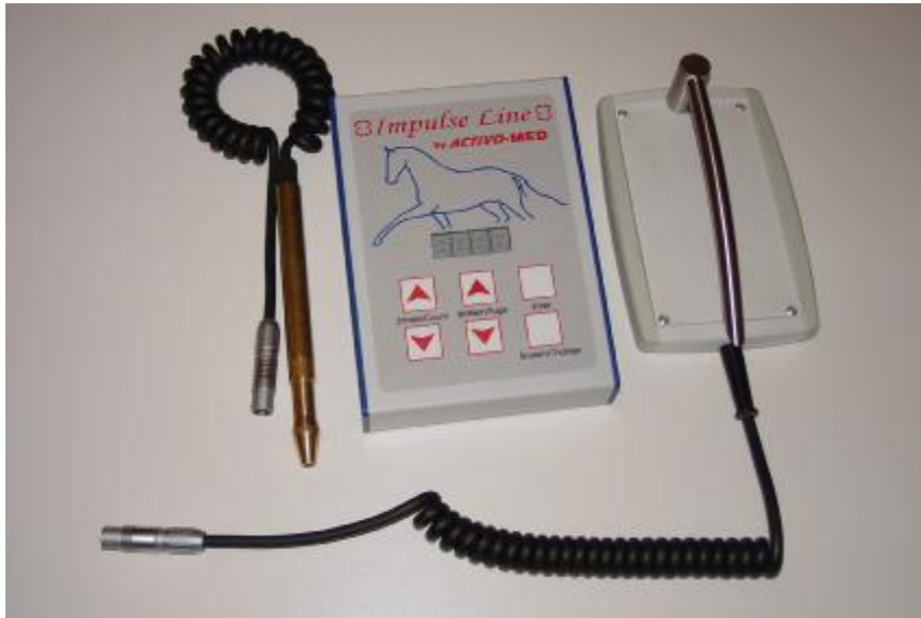
Steuereinheit, Magnetfeld-Lichtdusche und WLP Pointer